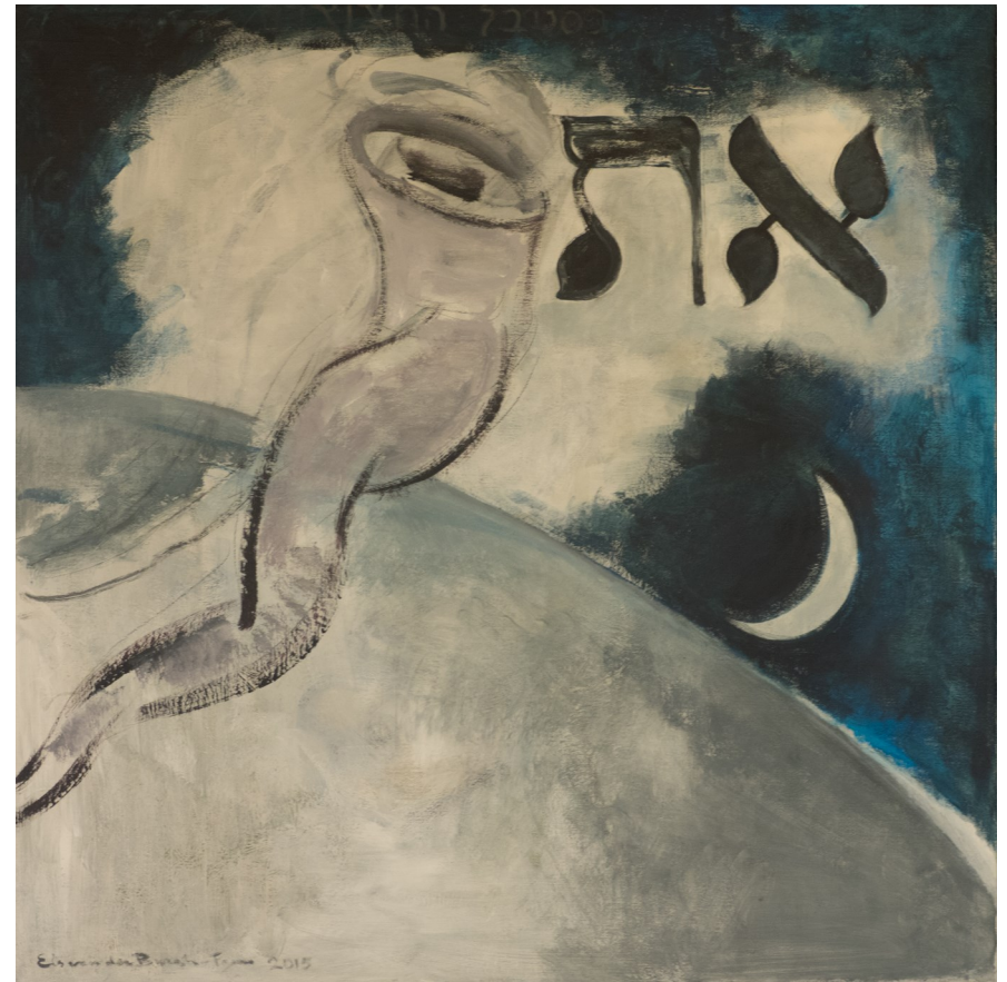
Yom Teruah, Het bazuinenfeest.